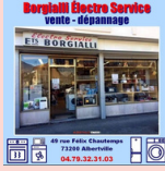
Ets Borgialli ALBERTVILLE