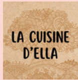
La Cuisine d'Elle VAL-CENIS