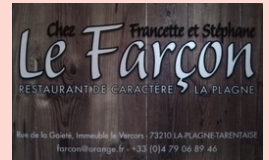
Le Farçon ROGNAIX