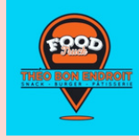
Théo Bon Endroit MOUTIERS