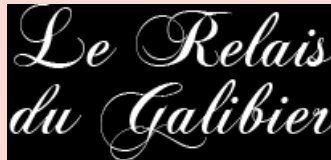
Le Relais du Galibier VALLOIRE