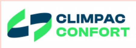
Climpac Confort LA BRIDOIRE