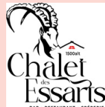
Le Chalet des Essarts VAL-CENIS