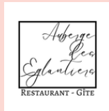
L'Auberge des Eglantiers FLUMET