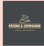
Pâtons & Compagnie CHAMBERY