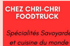
Chez Chri-Chri AILLON-LE-JEUNE