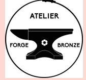
Atelier Forge et Bronze NOVALAISE