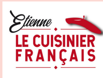
Le Cuisinier Français LA TRINITE